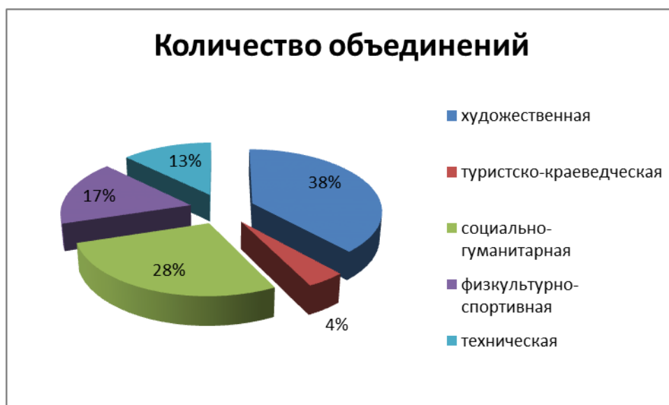
Таблица №4. Кол-во обучающихся по годам обучения (диаграмма №2)